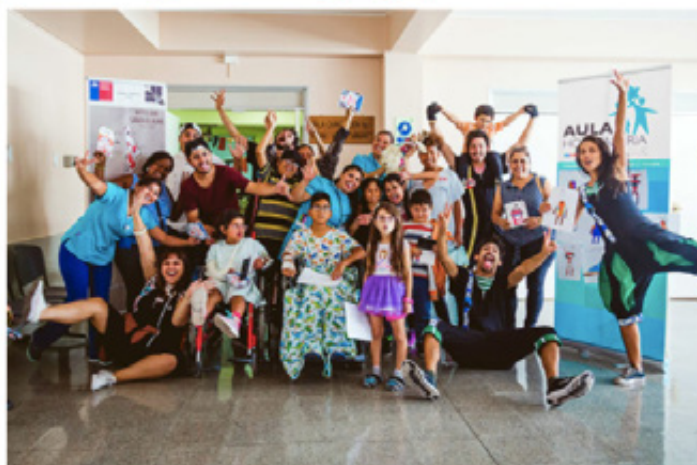
La compañía de teatro El Perro Bufo continúa su viaje por Chile, llevando sus obras lambe-lambe a niños hospitalizados.