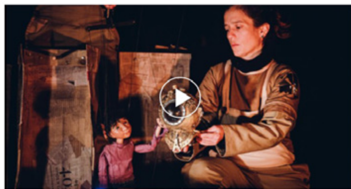
Detrás de las Máscaras | Amor por ti