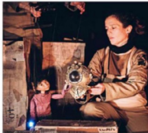
"Amor por ti" lleva a escena las experiencias de jóvenes recluidos en el Centro de Internación Provisoria (CIP) de San Joaquín.

Bajo la guía de especialistas médicos, psicólogos y arte terapéuticos, la